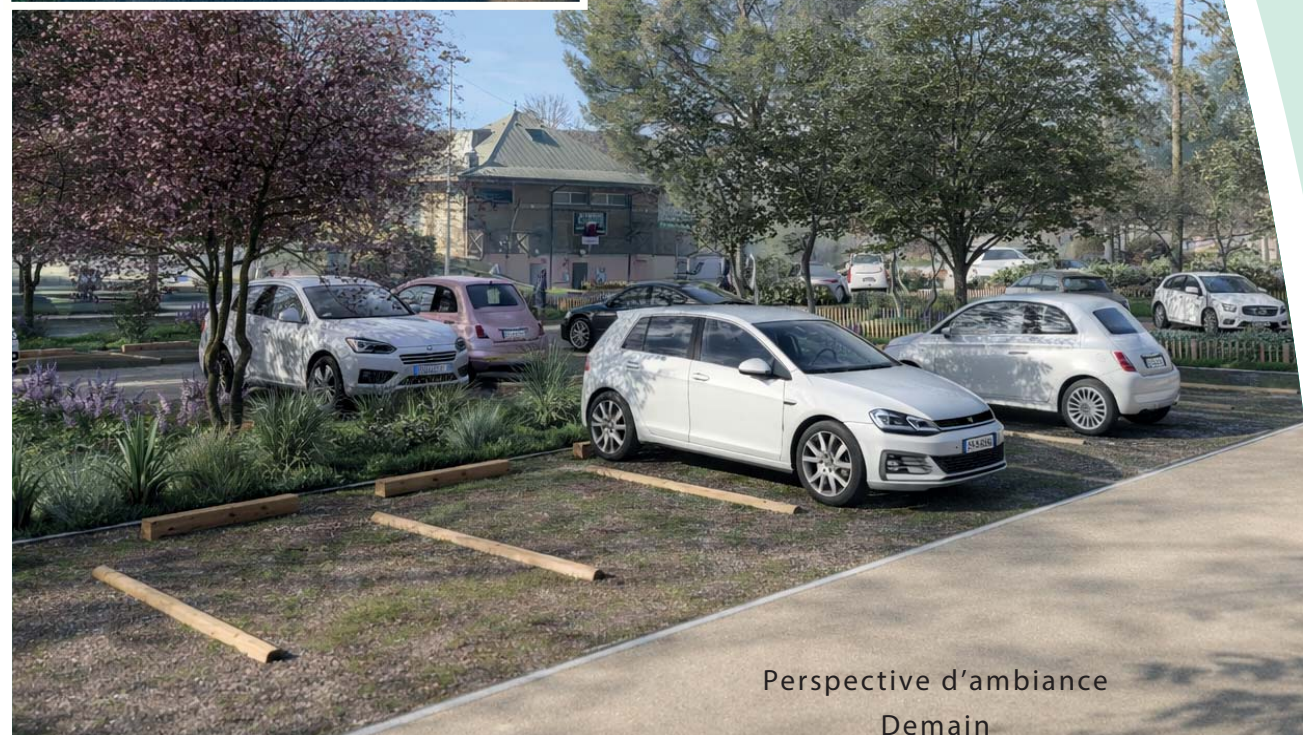
Perspective d'ambiance Demain