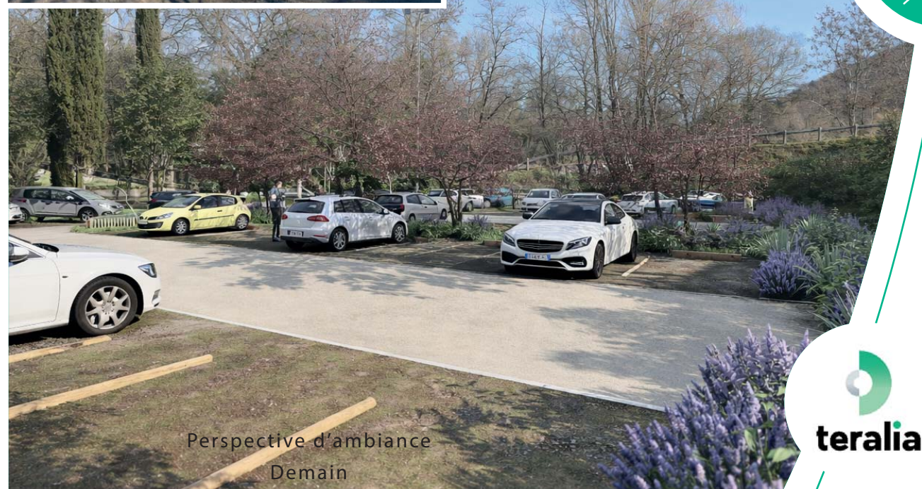
Perspective d'ambiance Demain