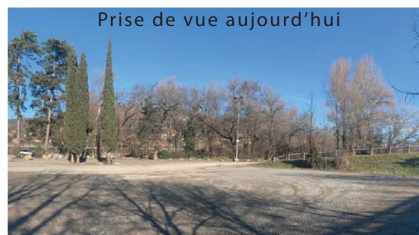
Prise de vue aujourd'hui