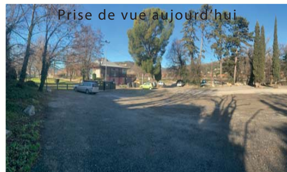
Prise de vue aujourd'hui